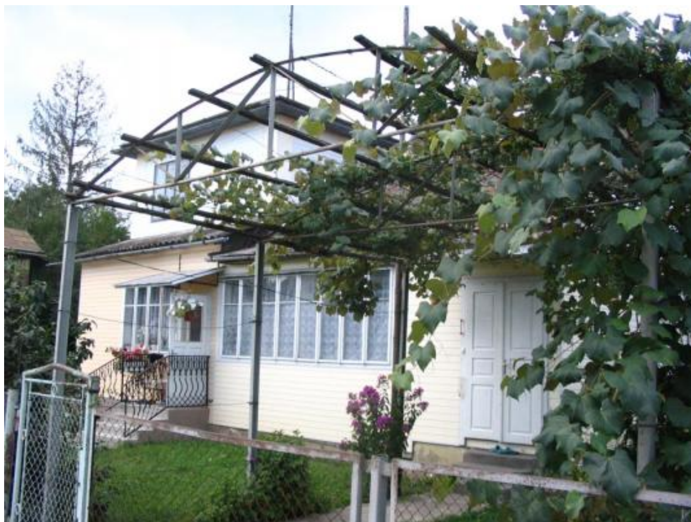
Solotwin cemetery, tombstones A022, A023, A024, A0