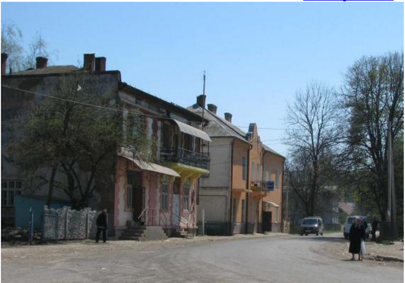
Solotvyn, Former Jewish Houses (marketplace)