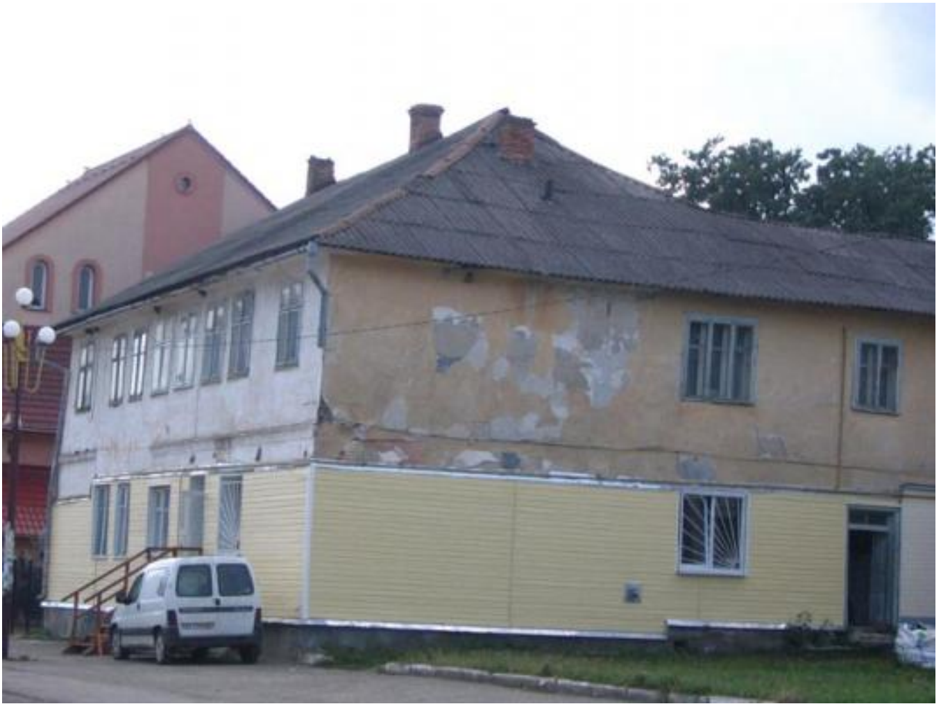
Solotvyn, House of Kuker 01