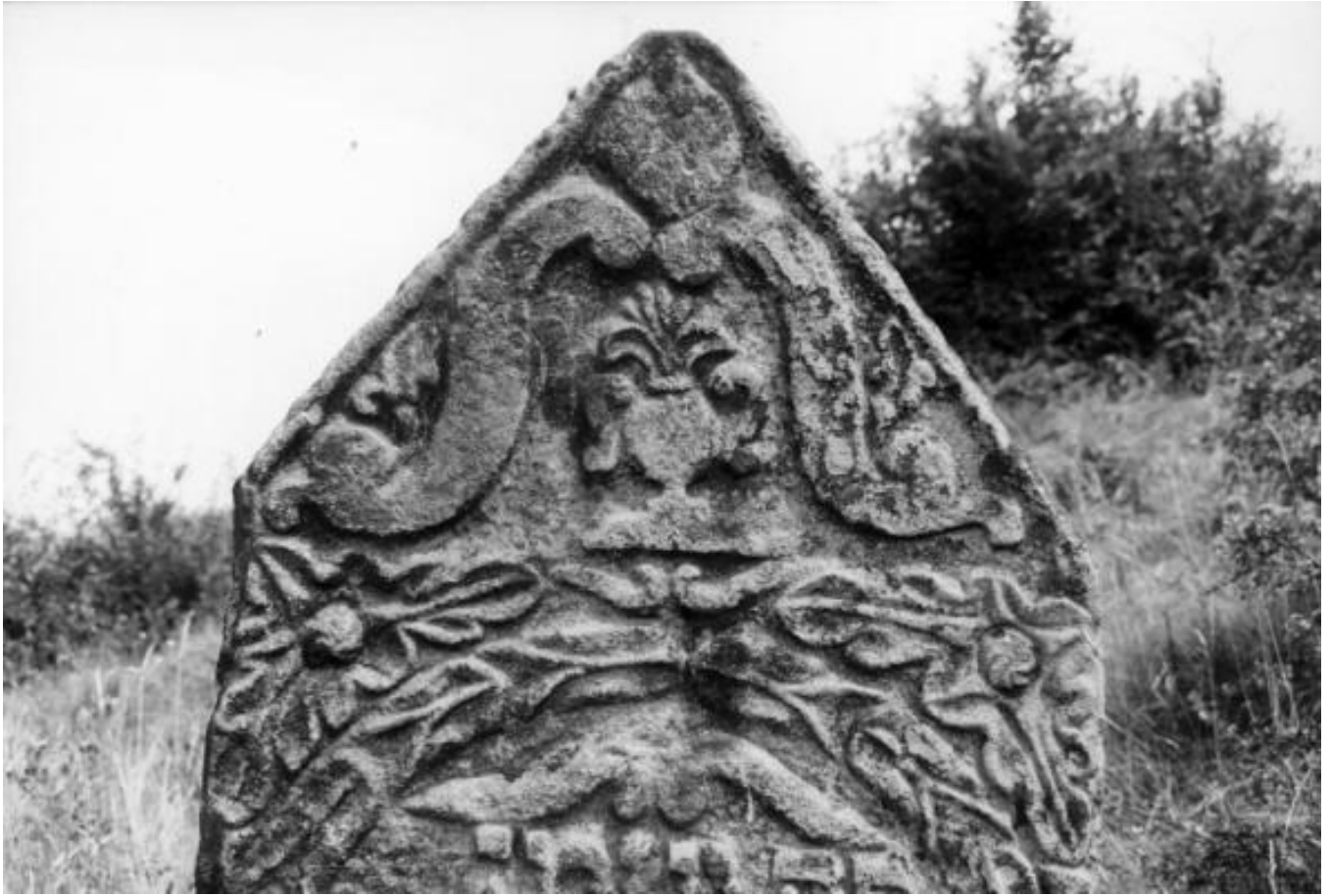
Solotvyn, Class Photograph 1937