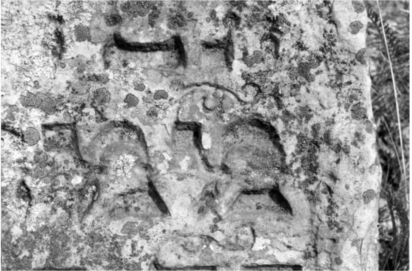
Solotvyn, A Place of a Jewish Eggs Seller