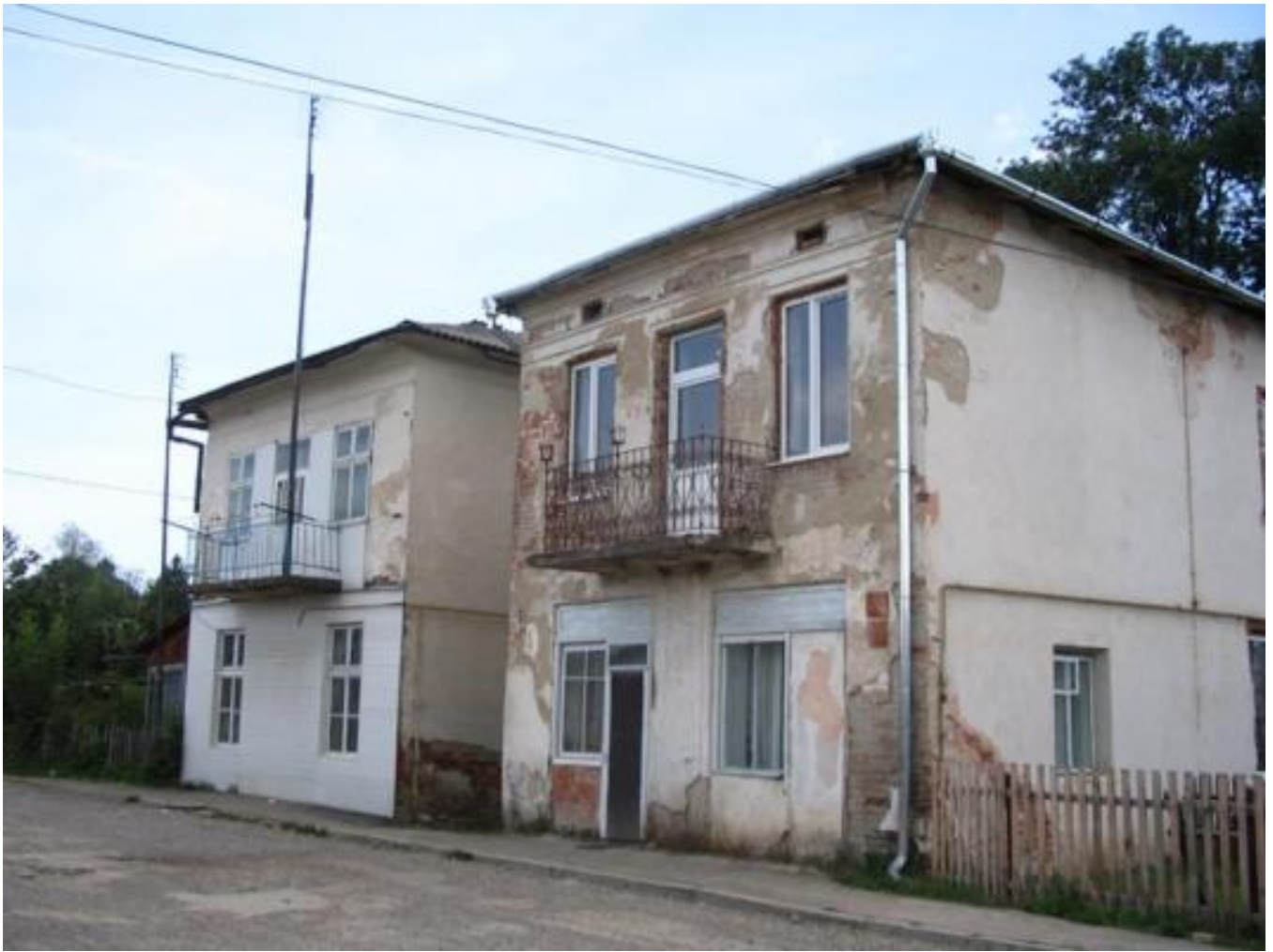
Solotwin cemetery, tombstone B048