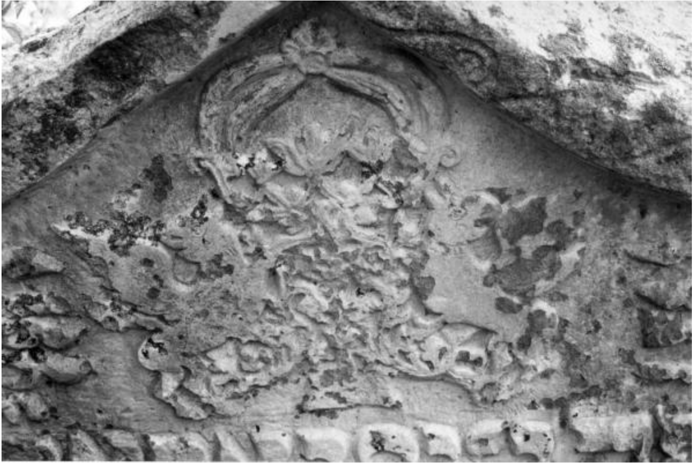
Solotvyn, House of Doctor Tyger II