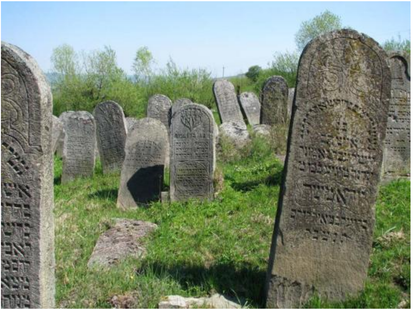
Solotvyn cemetery, tombstone A2.12c