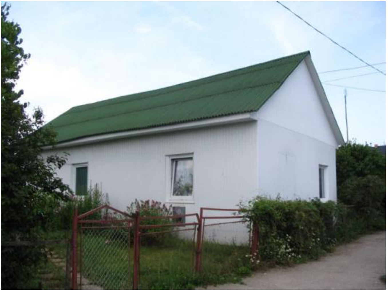
Solotvyn, Jewish Houses