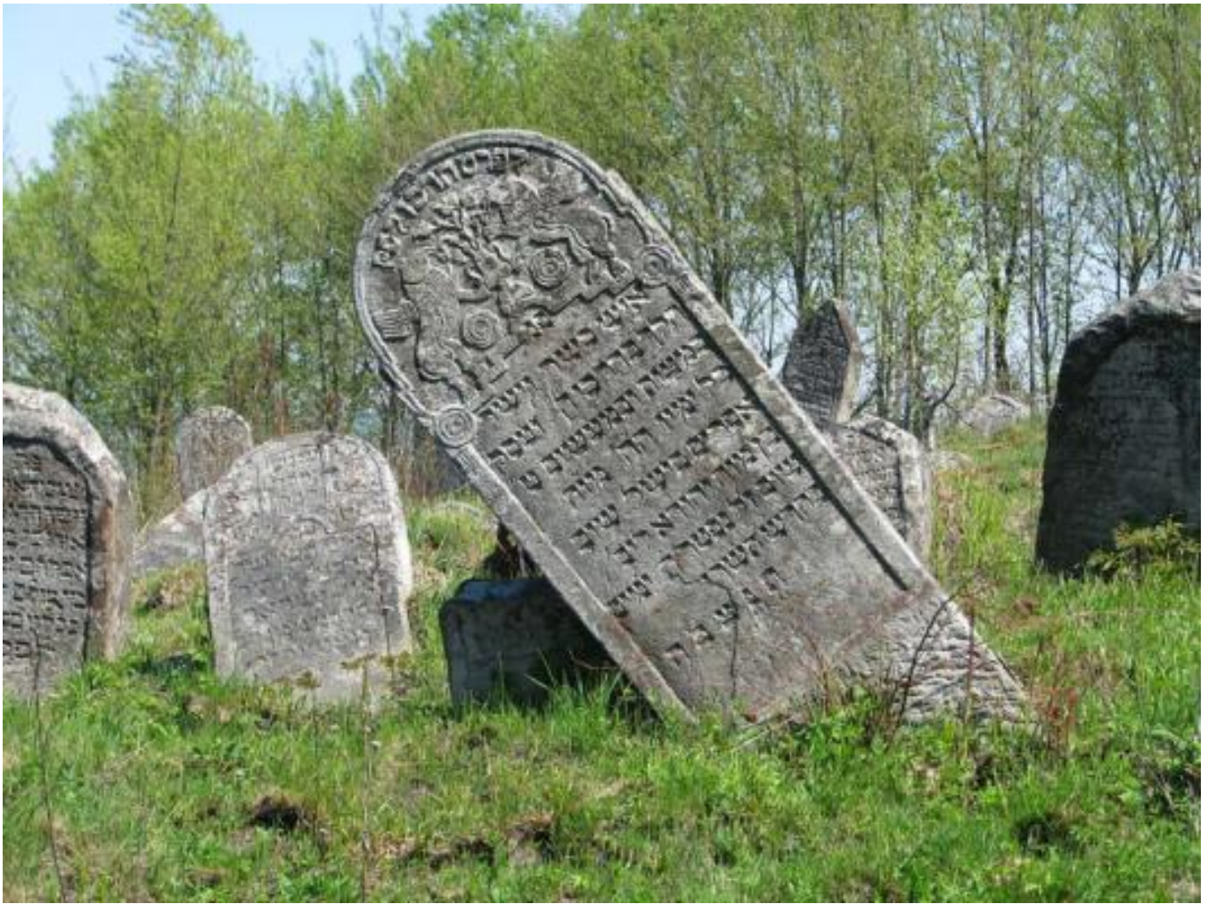
Solotvyn cemetery, tombstone L071c detail