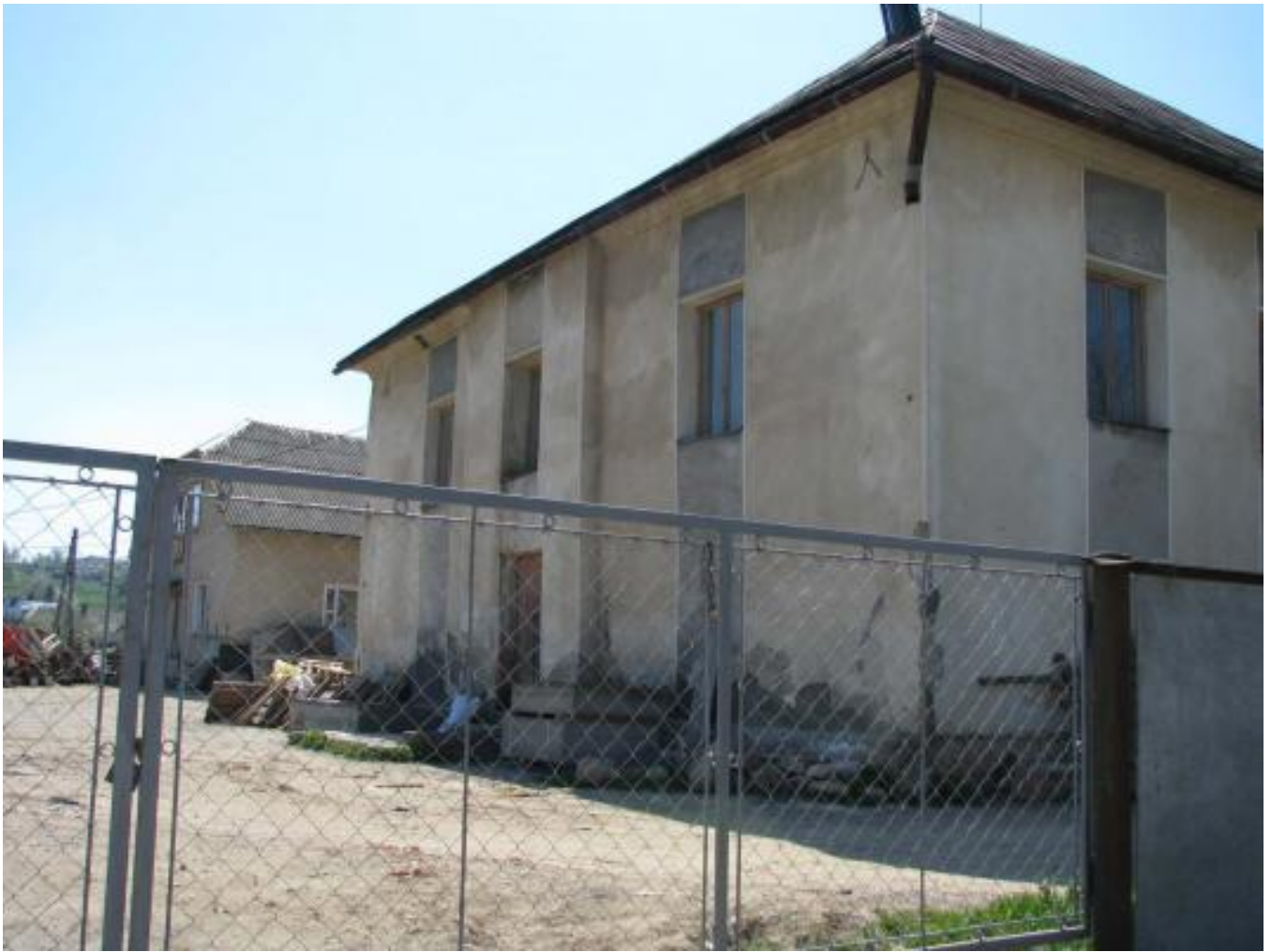
Solotvyn, Miller's House