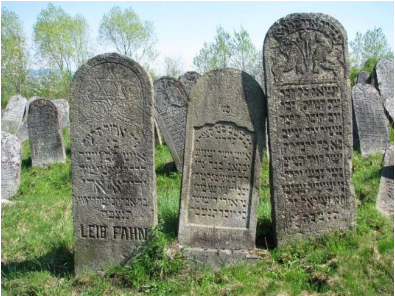
Solotvyn cemetery, tombstone A1.28b