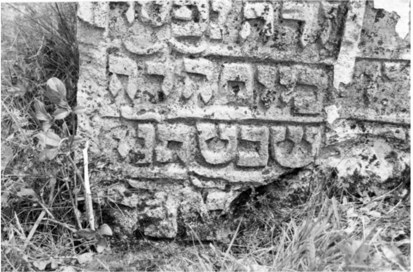
Solotvyn, House of the Lawyer Chernenko