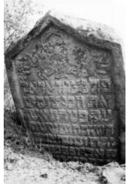
Solotvyn cemetery, tombstone lmg 8012