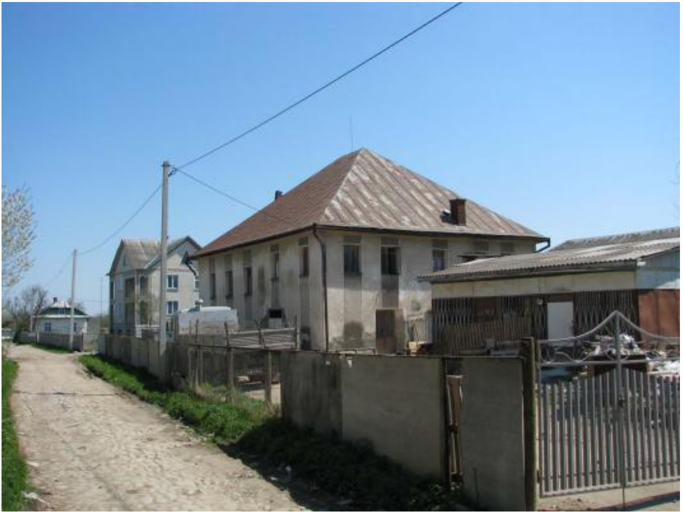
Solotvyn, Former Jewish Shop