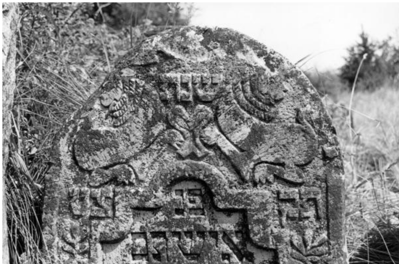
Solotvyn cemetery, tombstone H088c (1999) detail