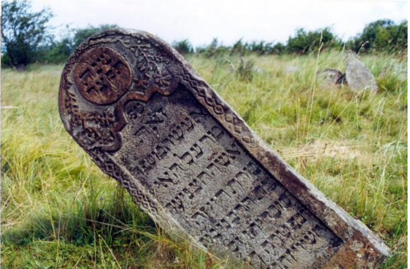
Solotvyn cemetery. tombstone H085