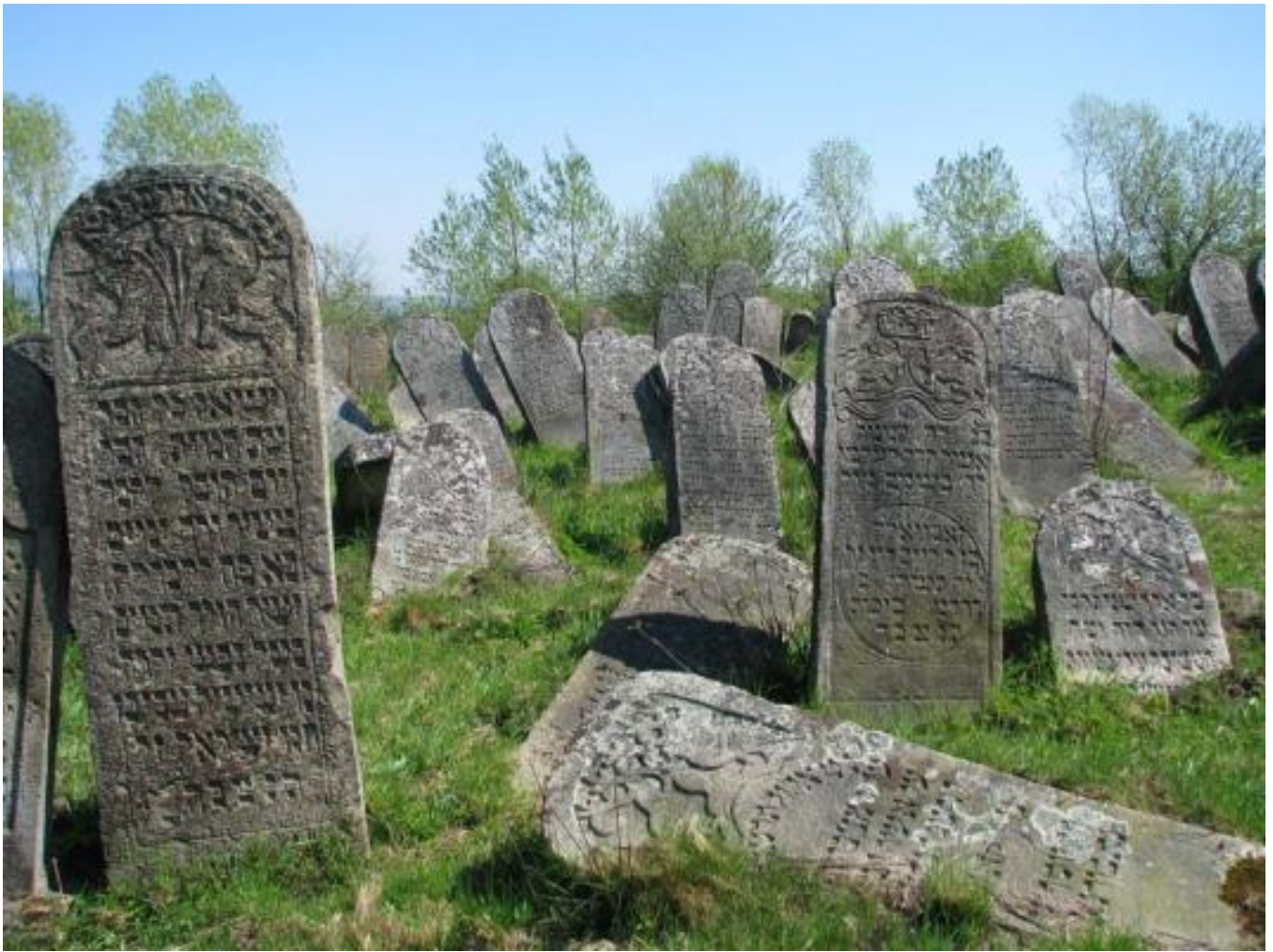
Solotvyn cemetery, tombstone