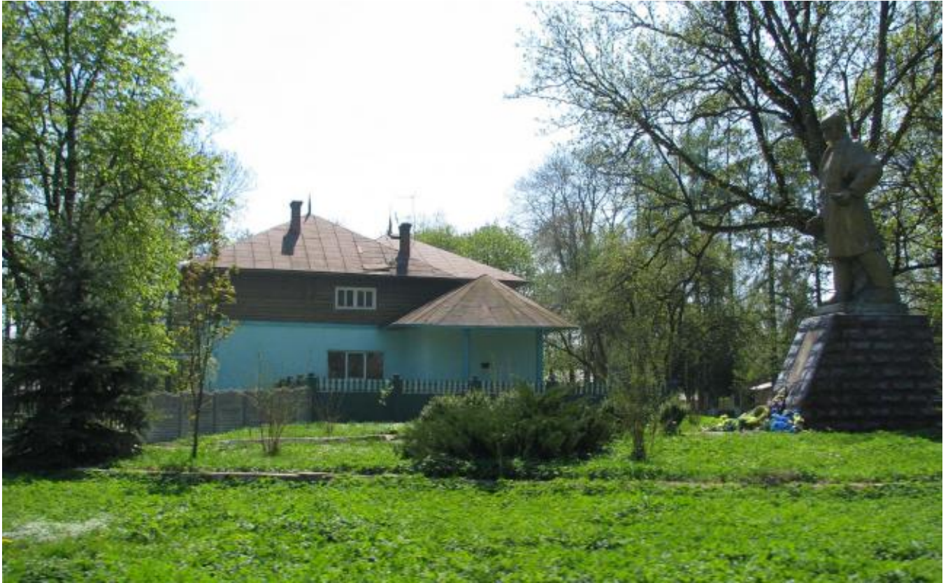
Solotvyn - pre-WWII photograph