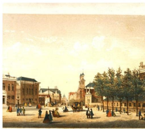
Амстердам. Литография В. Хэкинга, 1861 г. Слева Большая и Новая синагоги, справа Португальская синагога