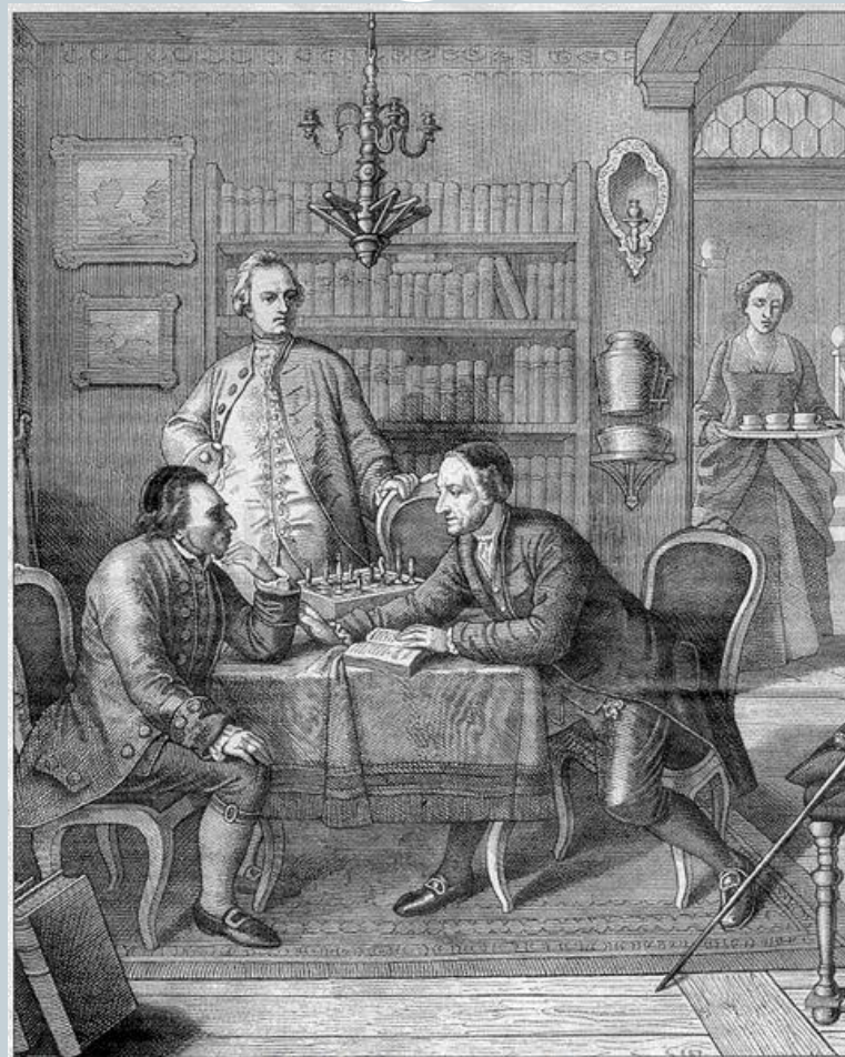
Мориц Оттенгейм "Диспут с Лафатером", 1856