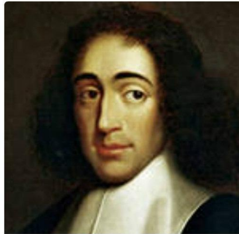
Барух Спиноза (1632-1677)