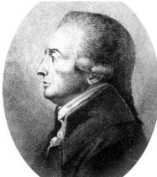
Саломон Маймон (1753-1800)