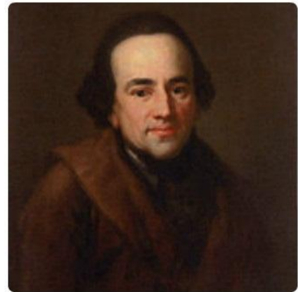
Моисей Мендельсон (1729-1786)