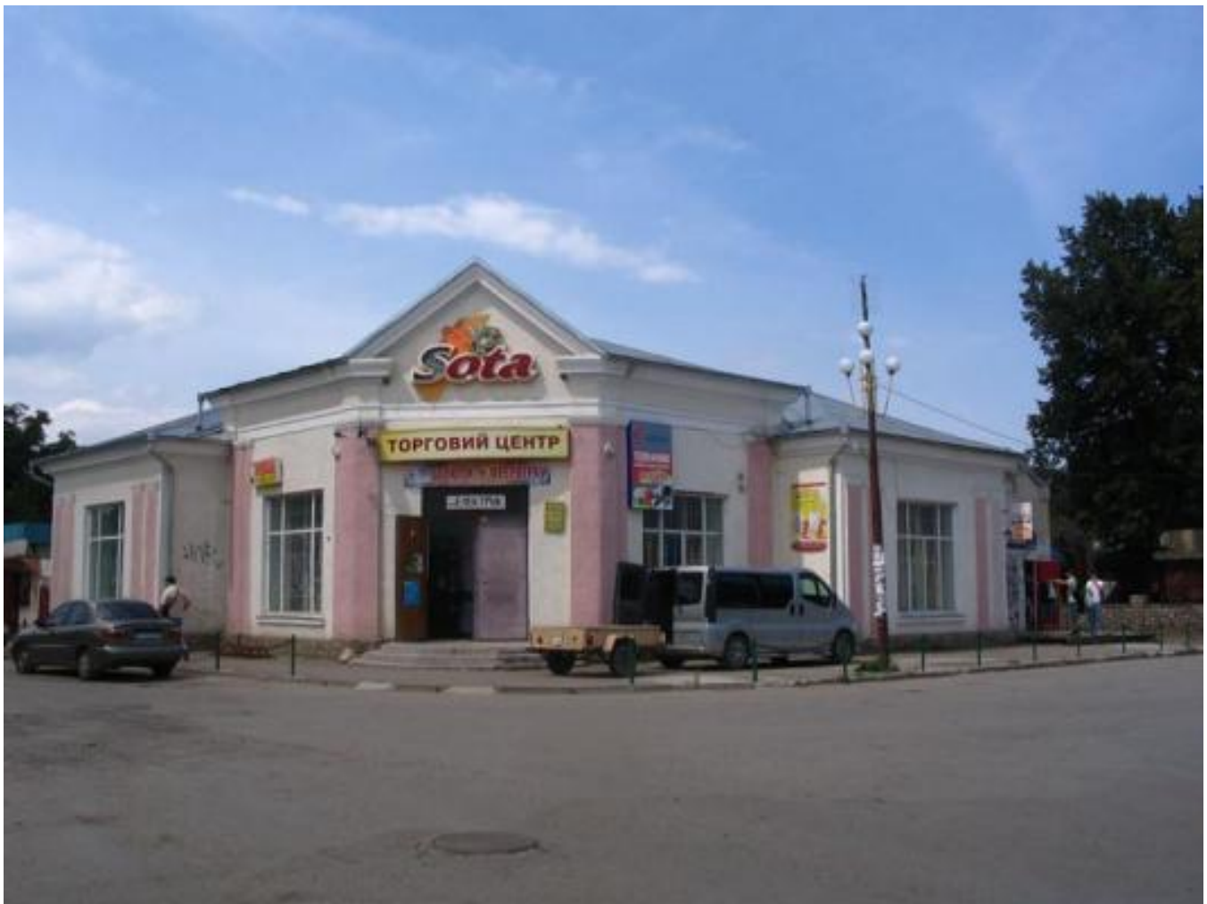
Synagogue in Solotvyn