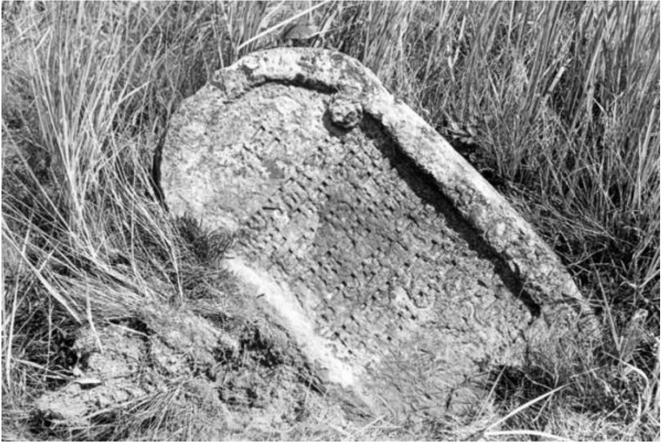
Igel family - Solotvyn