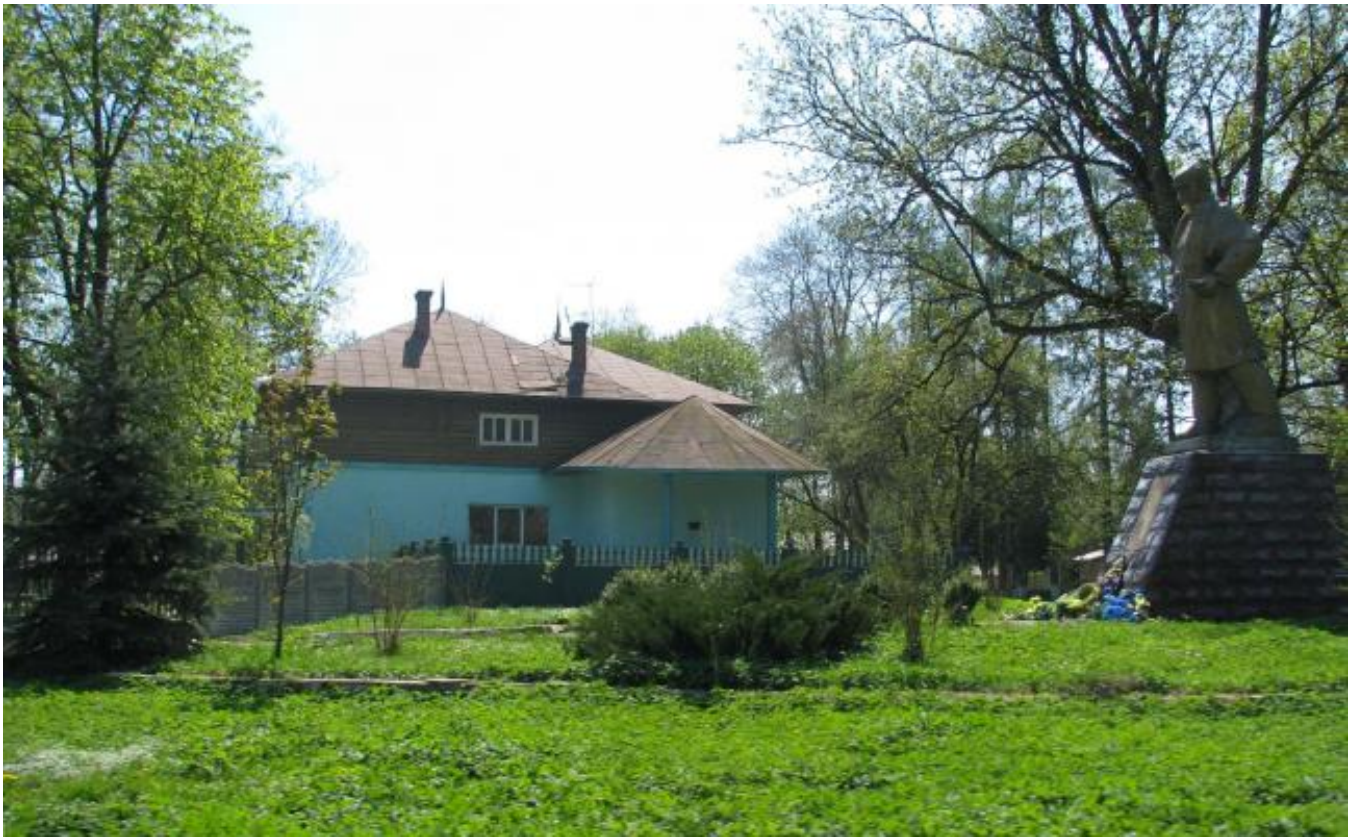
Solotwin cemetery, tombstone A017