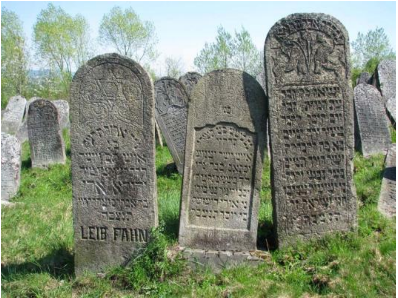
Solotvyn cemetery, tombstone A1.28b