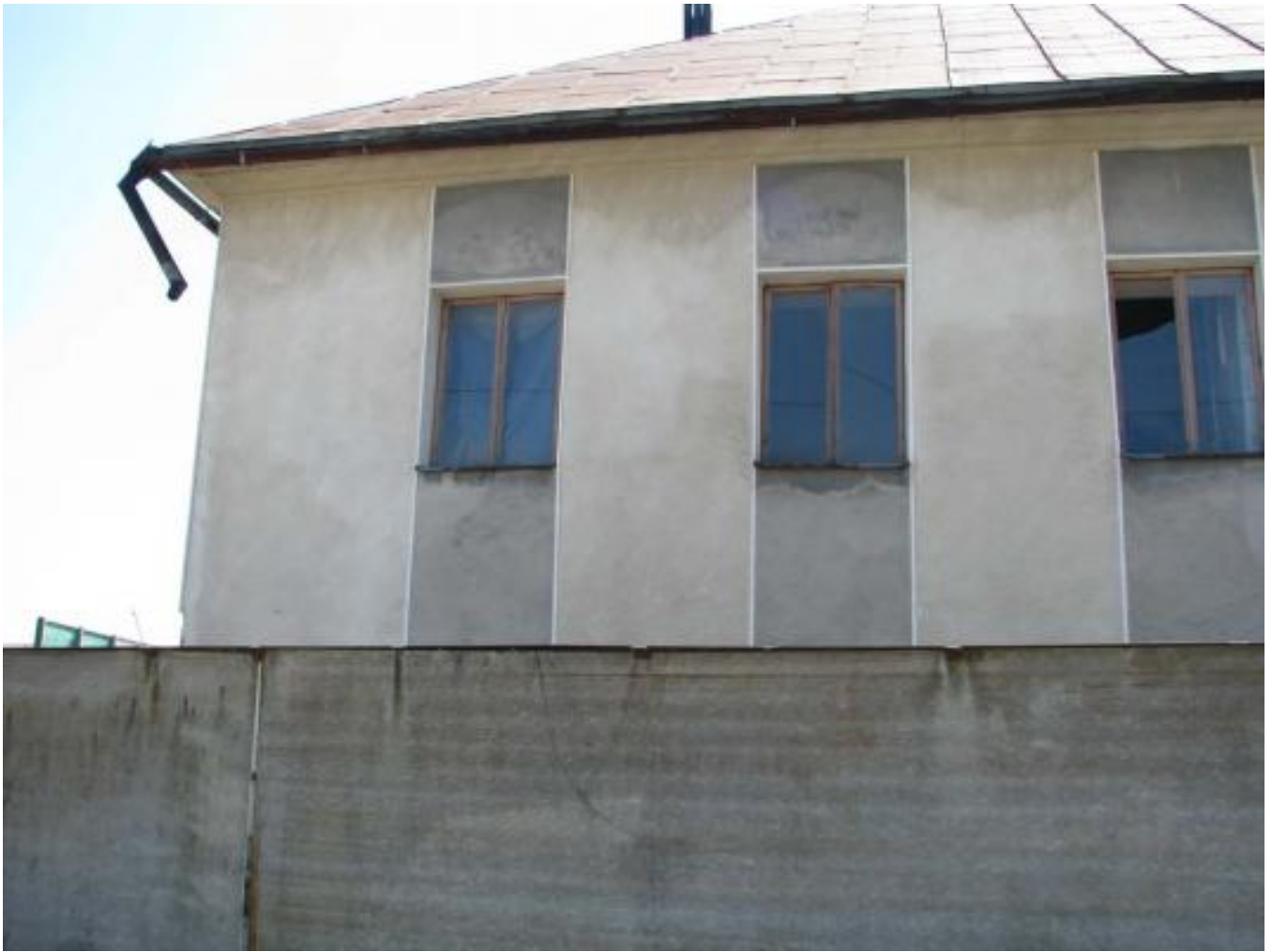
Solotvyn, Coat of arms