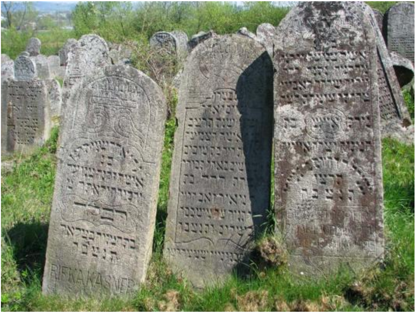
Solotvyn cemetery, tombstone