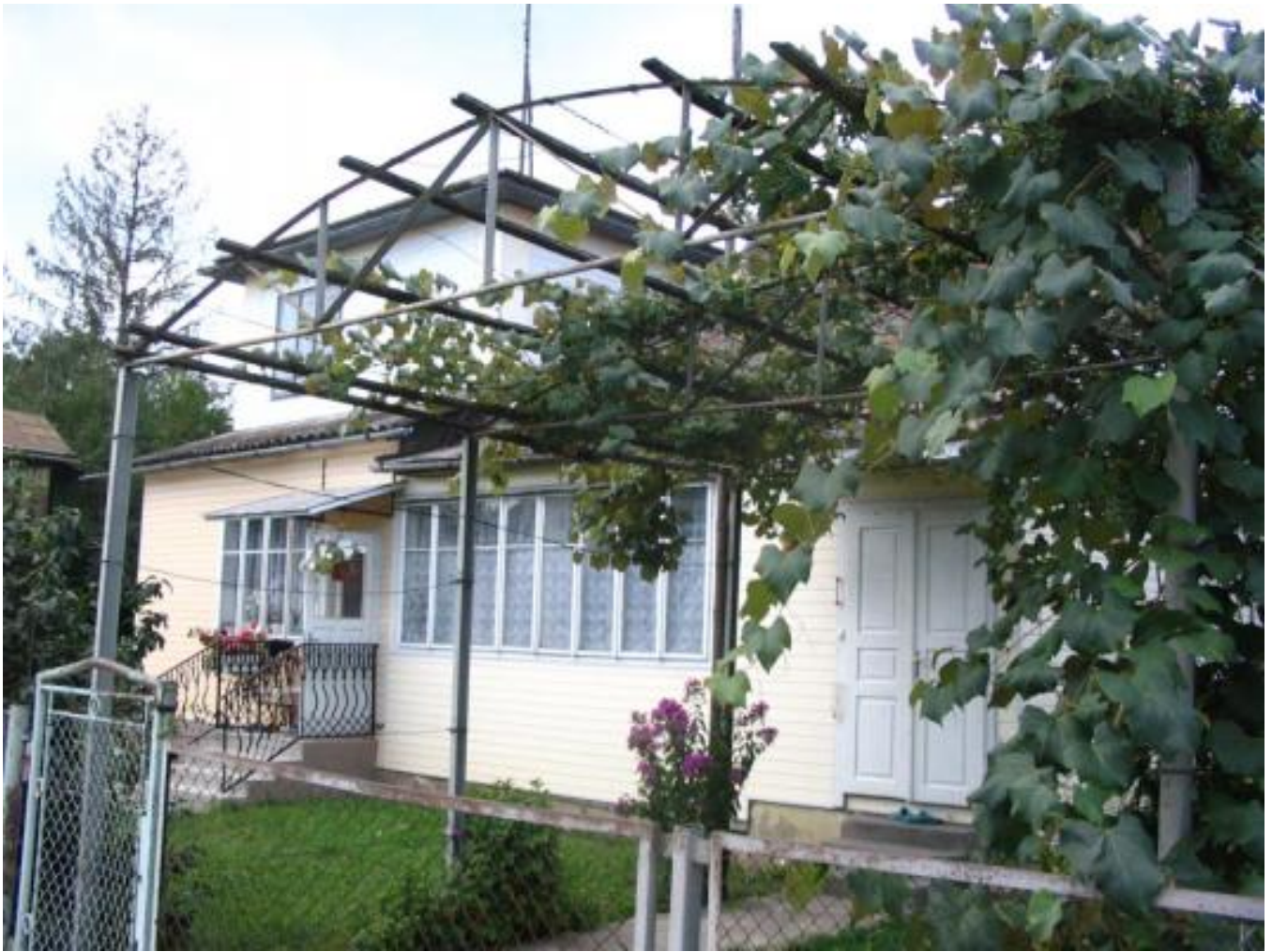
Solotwin, general view