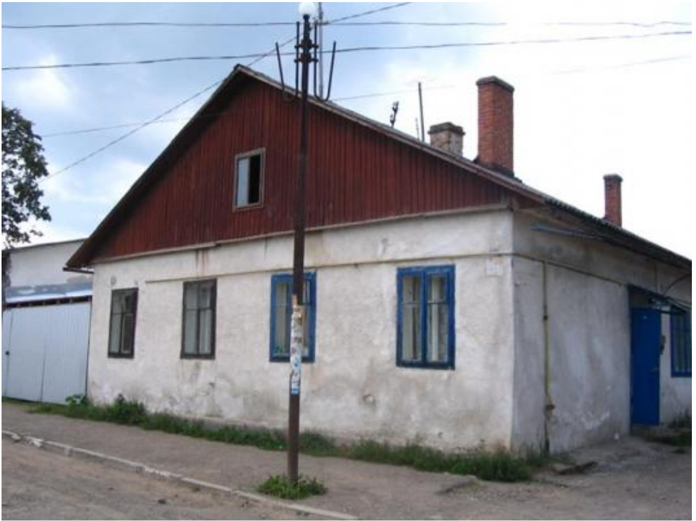
Synagogue in Solotvyn