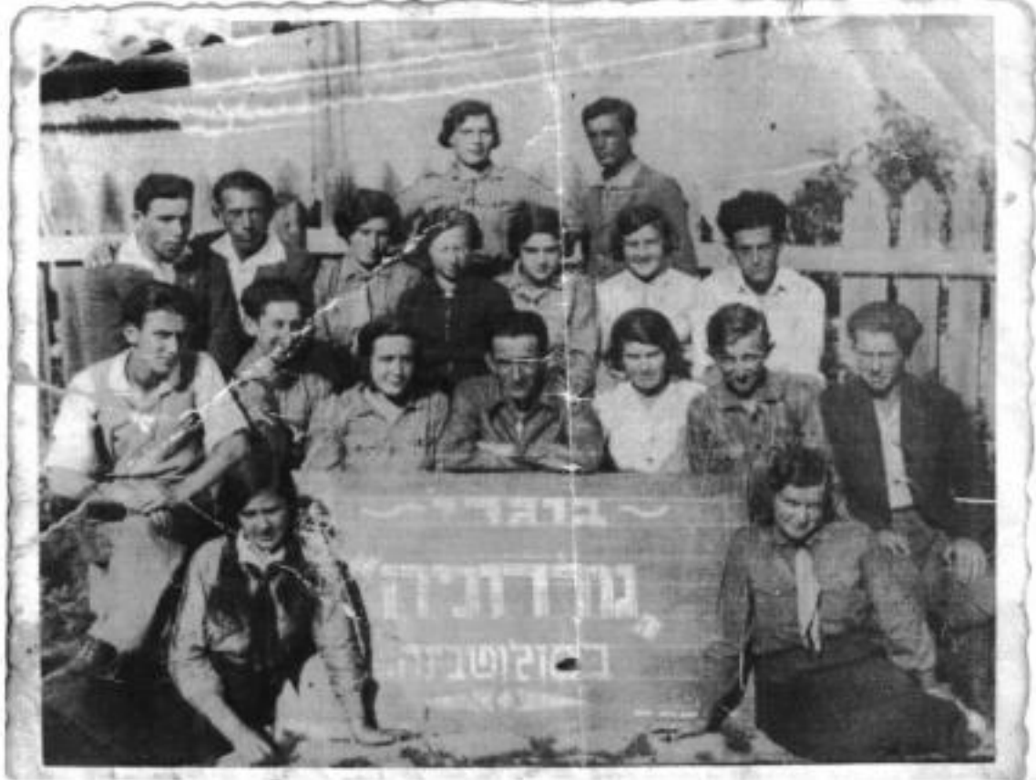
Solotvyn, House of Doctor Tyger II