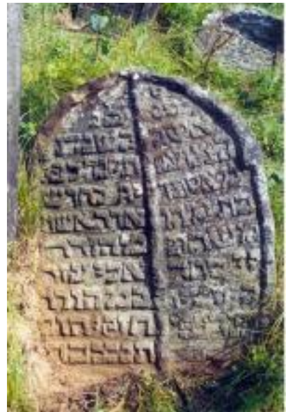
Solotwin cemetery, tombstone Img 7991