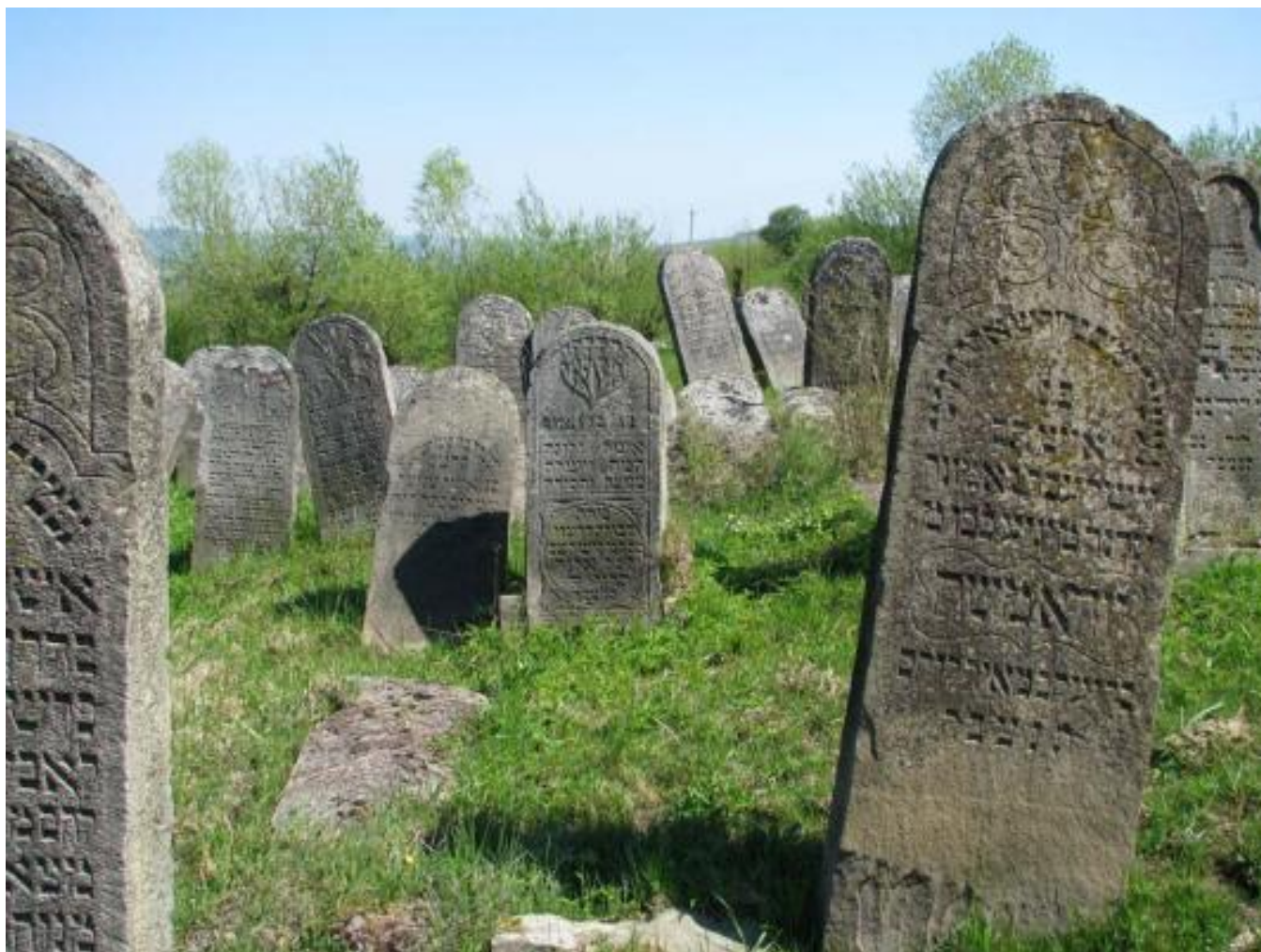
Solotvyn cemetery, tombstone A2.12c