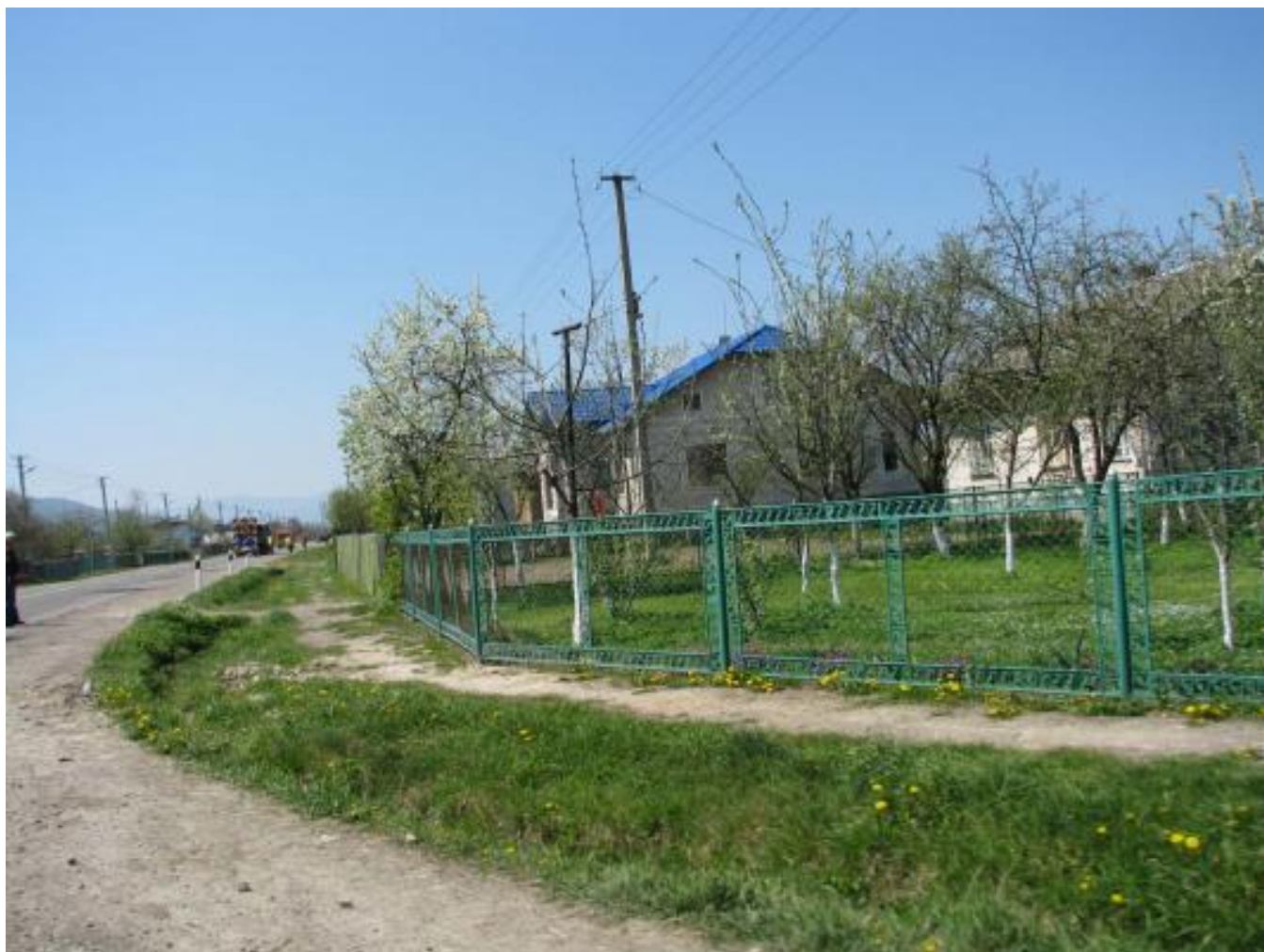
Solotwin cemetery, tombstones A022, A023, A024, A0