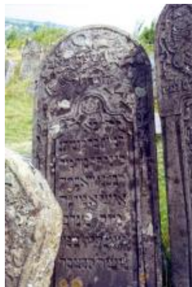
Solotvyn cemetery, tombstone A1.35a