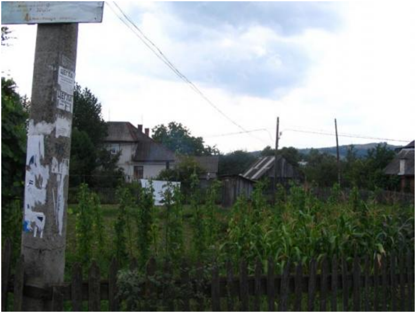
Solotvyn cemetery, tombstone H085