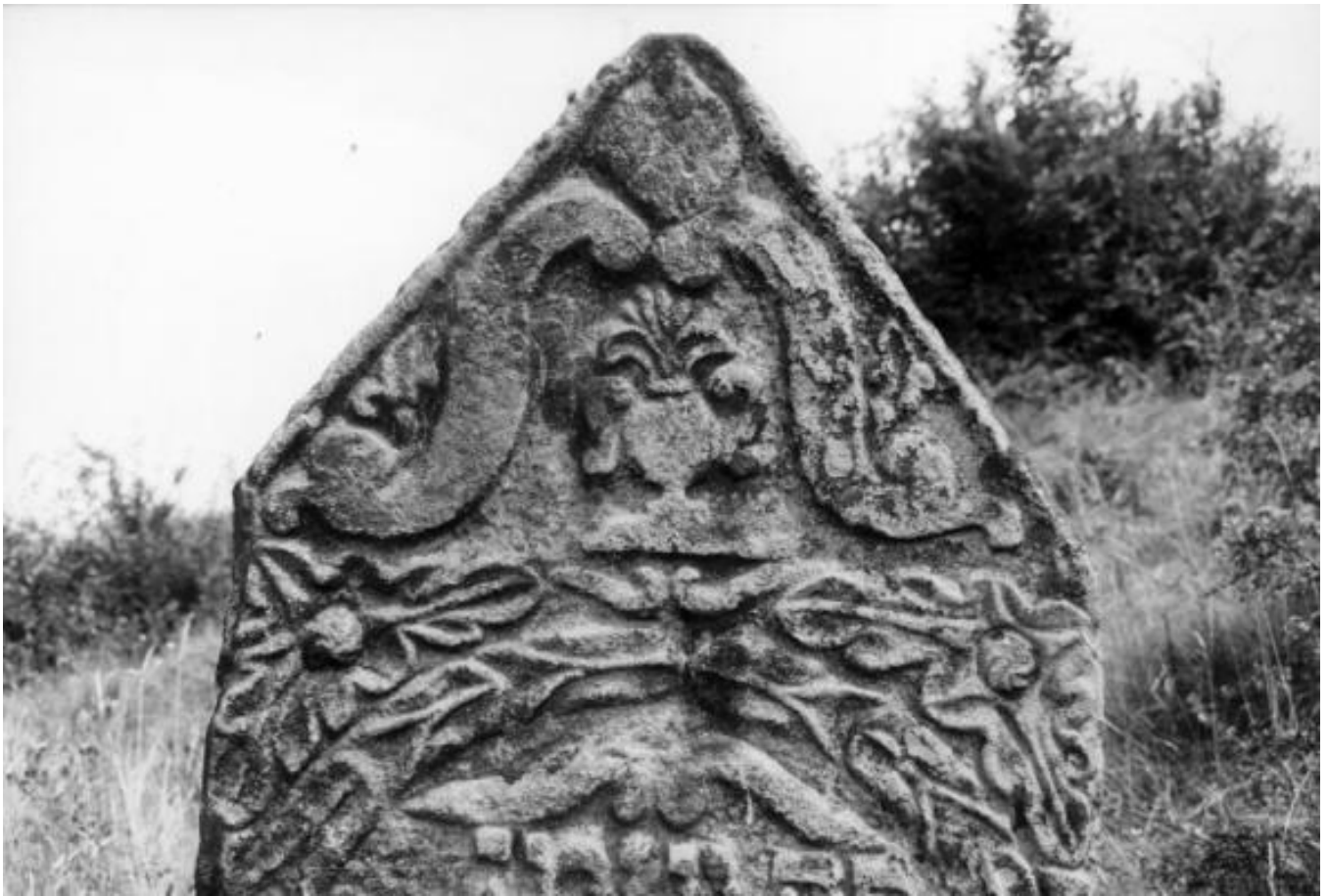
Solotvyn, House of Doctor Rubel