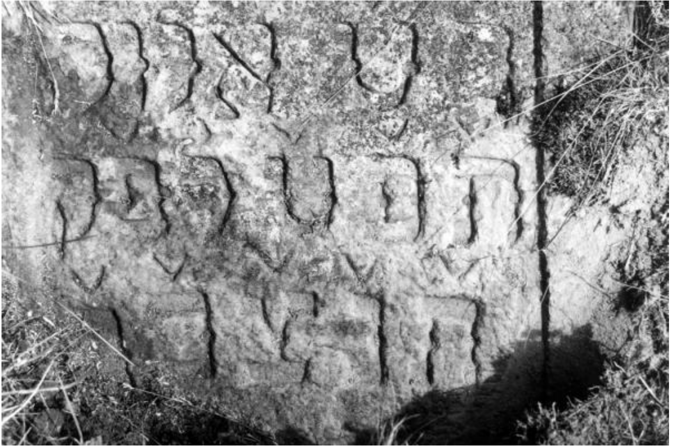
"Zeirei Hamizrahi" in 1922