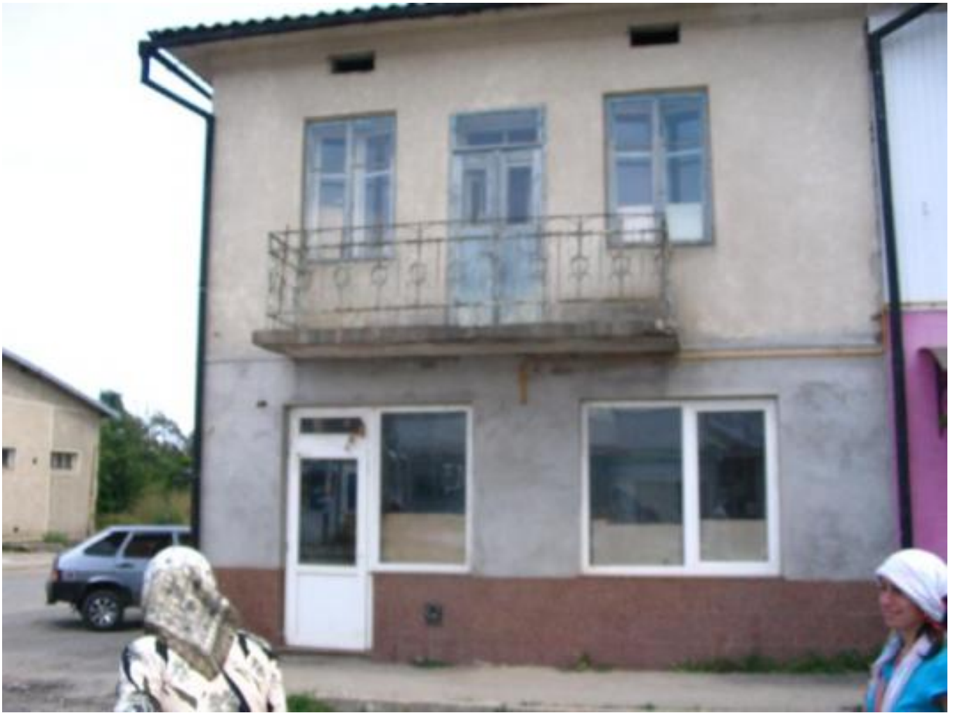
Synagogue in Solotvyn