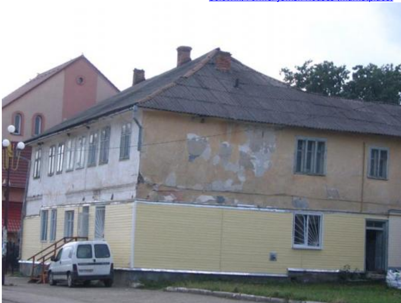
Solotvin, general view