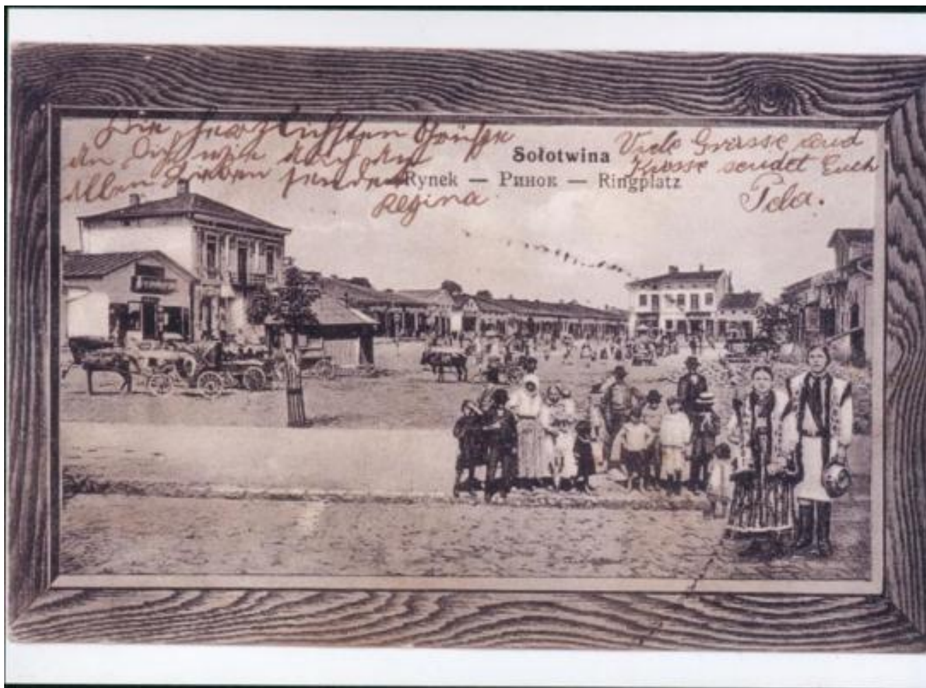
Solotwin, general view