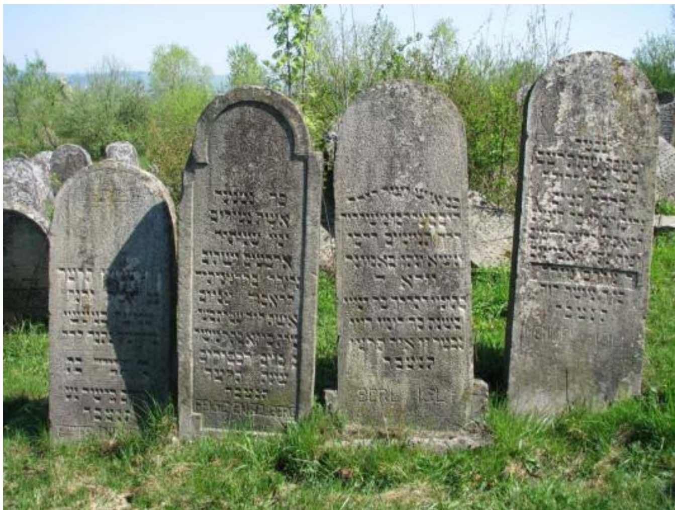
Solotvyn cemetery, tombstone A2.2b