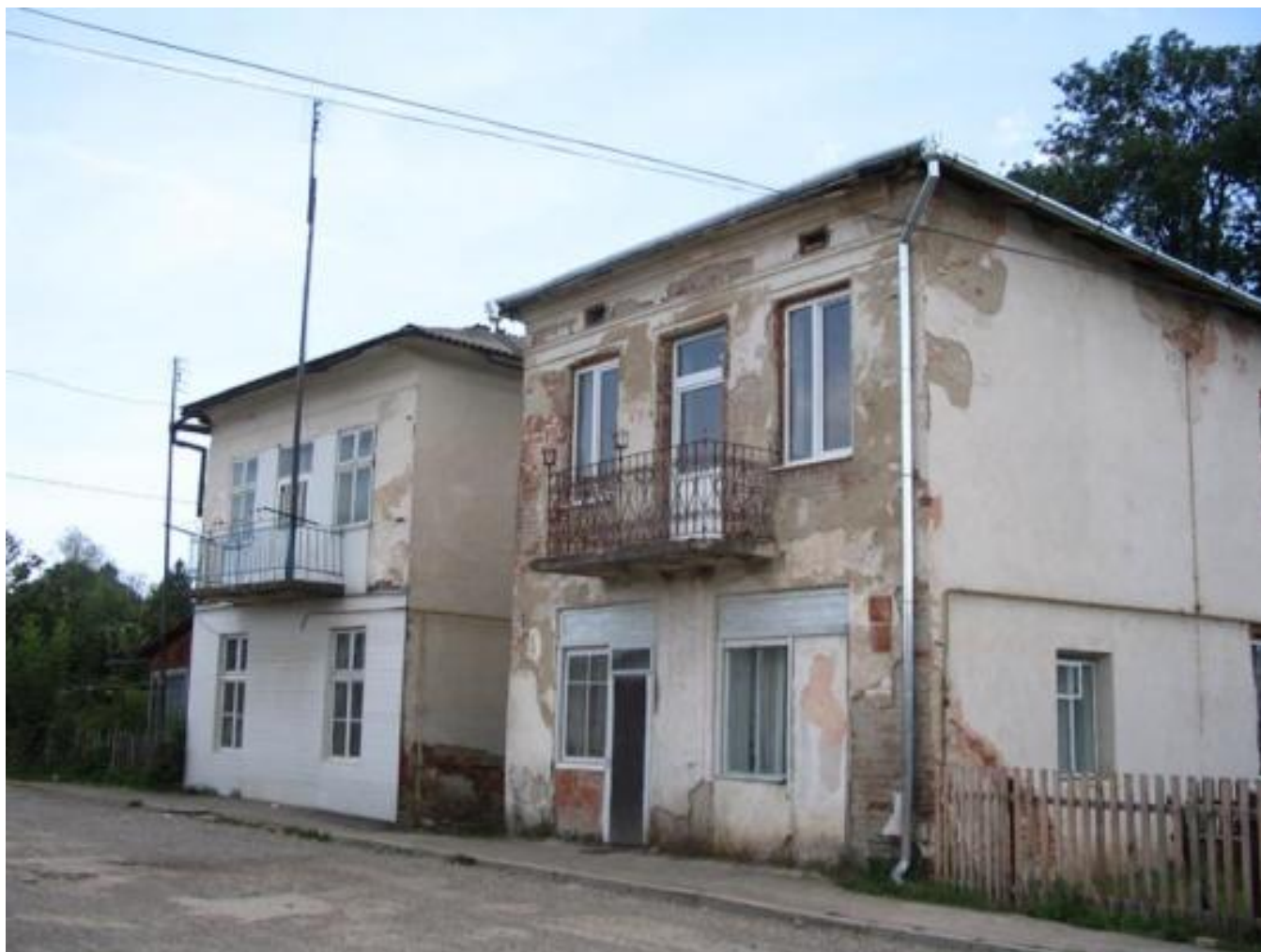
Solotvyn cemetery, tombstone B048