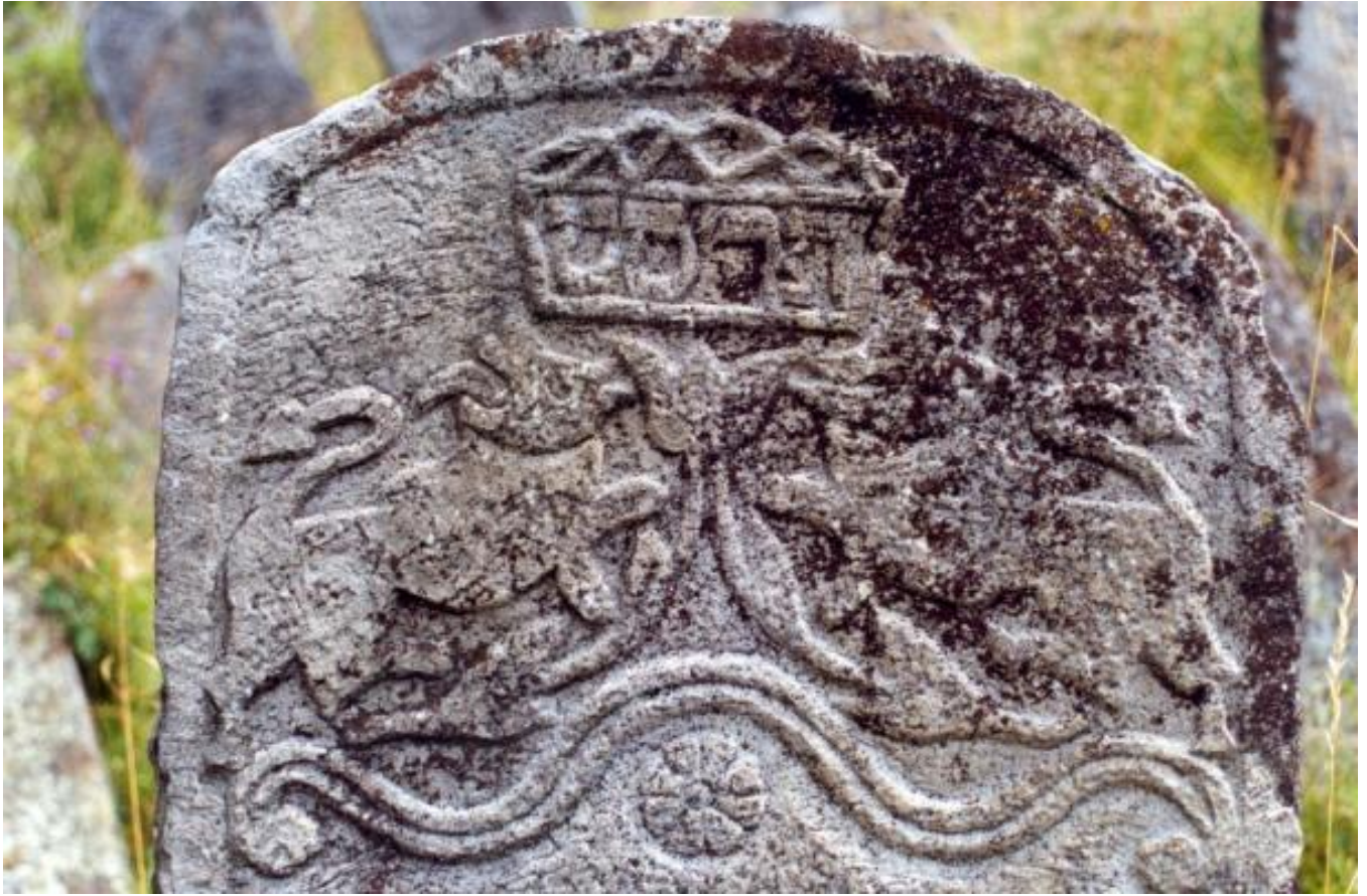
Igel Family - Solotvyn