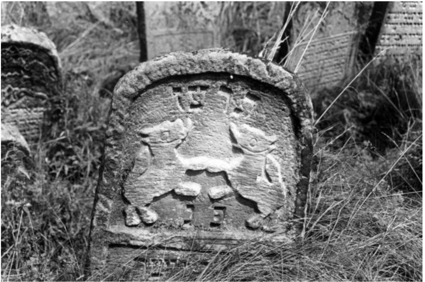
Solotvyn cemetery, tombstone K054b